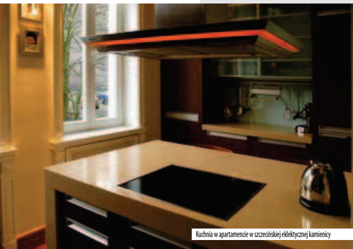
Kuchnia w apartamencie w szczecińskiej elektrycznej kamienicy