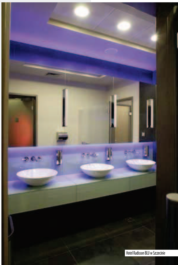
Hotel Radisson BLU w Szczecinie

Oprócz wiedzy, doświadczenia i talentu, w zawodzie architekta ważna jest znajomość psychologii. Czasami niektórzy klienci nie mówią