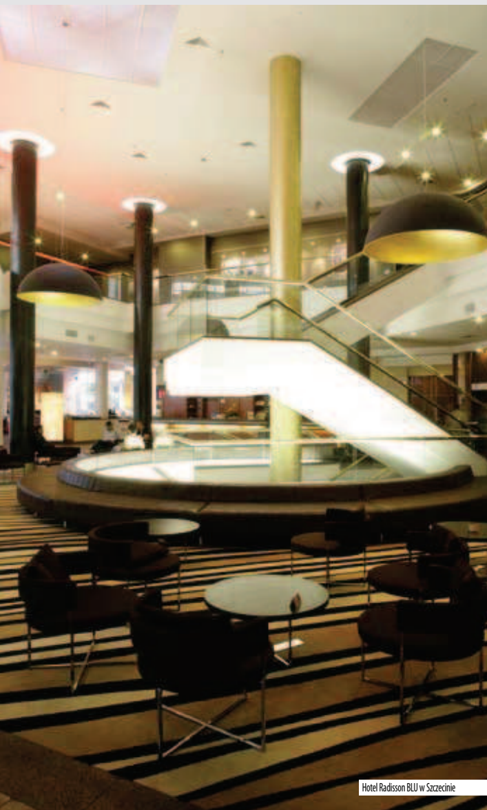
Hotel Radisson BLU w Szczecinie