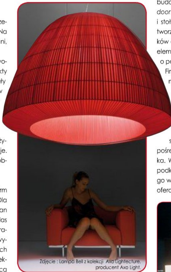
Zdjęcie : Lampa Bell z kolekcji Axo Lightecture, producent Axo Light.

Jednak ponad wszelką miarę cenione są produkty, w których wykonanie bezpośrednio zaangażowana jest ręka człowieka. Wiele włoskich firm w swoim programie podkreśla istotę czynnika ludzkiego, mającego wpływ na ostateczny kształt oraz wygląd oferowanego asortymentu. ■