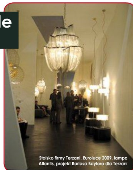
Stoisko firmy Terzani, EuroLuce 2009, lampa Atlantis, projekt Barlasa Baylora dla Terzani

Po raz kolejny w kwietniu odbyły się w Mediolanie Międzynarodowe Targi SALONI – największa i najstawniejsza wystawa mebli na świecie. To już trzydziesta pierwsza międzynarodowa edycja targów, a czterdziesta ósma – narodowa.