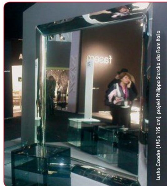
Lustro Caadre (195 x 195 cm), projekt Philippa Staricka dla Fiam Italia

Meble wypoczynkowe to przeważnie systemy modułowe, pozwalające na dużą swobodę w dopasowaniu do określonej przestrzeni. W wielu wypadkach ciągle jeszcze dominują marszczenia, pikowania, obciągnięte guziki, szczypanki i przeszyca. Łączone tkaniny są jednobarwne, mogą się różnić fakturą i wówczas jest to celowo zaakcentowane. Wspólne