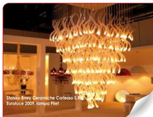
Stoisko firmy Ceramiche Carlesso S.R.L., EuroLuce 2009, lampa Pilet